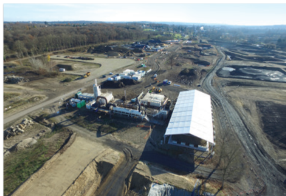
Vue générale du chantier depuis le Nord avec l'unité de désorption thermique au premier plan et la zone des travaux au second.

Cependant, l'ensemble des travaux a été réalisé et tous les matériaux ont été traités sur site ou hors site. L'ensemble des fonds et flancs de fouilles a été réceptionné.