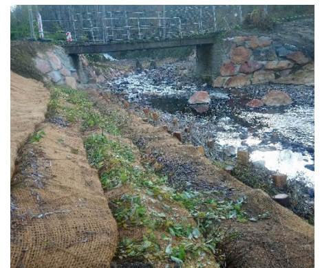
Protection de berges par des souches et fascines de saules.