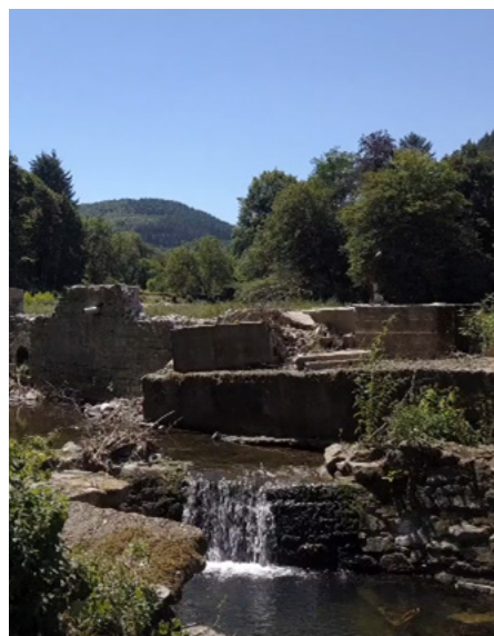
Le site industriel de Tarare Ouest (début XX ème siècle) et la Turdine avant travaux (hiver 2019 et printemps 2020).