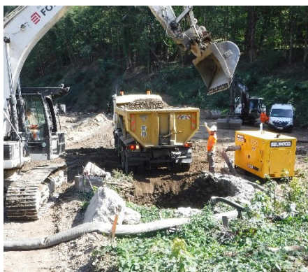
Remblaiement des puits avec les rhizomes de Renouée et les terrains inertes criblés.

Le tronçon est classé en réserve de pêche, cet usage de loisir sera favorisé par l'accessibilité des berges. Cependant, les populations piscicoles dominées par