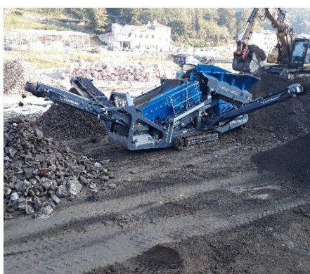
Criblage avant export.