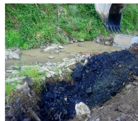
Maille déclassée (matériaux concentrés en COT, Arsenic et Antimoine)