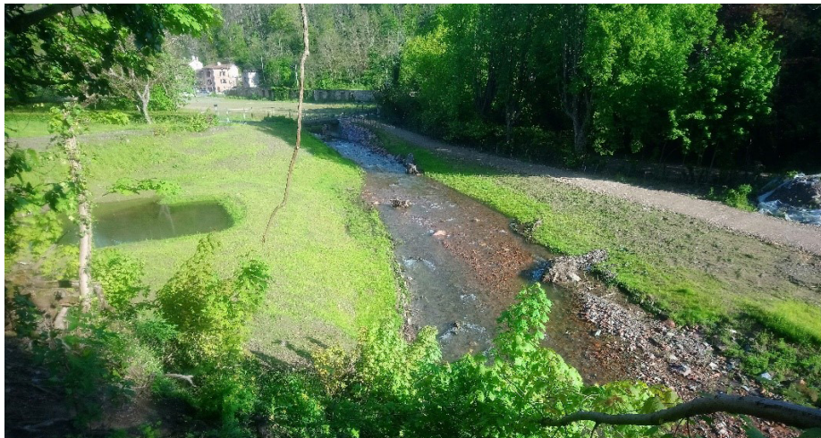
Vue des aménagements un an après travaux : zones humides, cheminement piéton et tronçon au droit des anciennes teintureries.

la Truite fario et le Chabot pourraient être impactées par une pollution du cours d'eau.